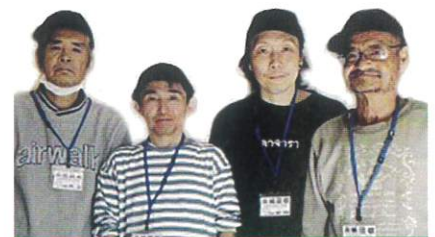
私たちがお伺いします！