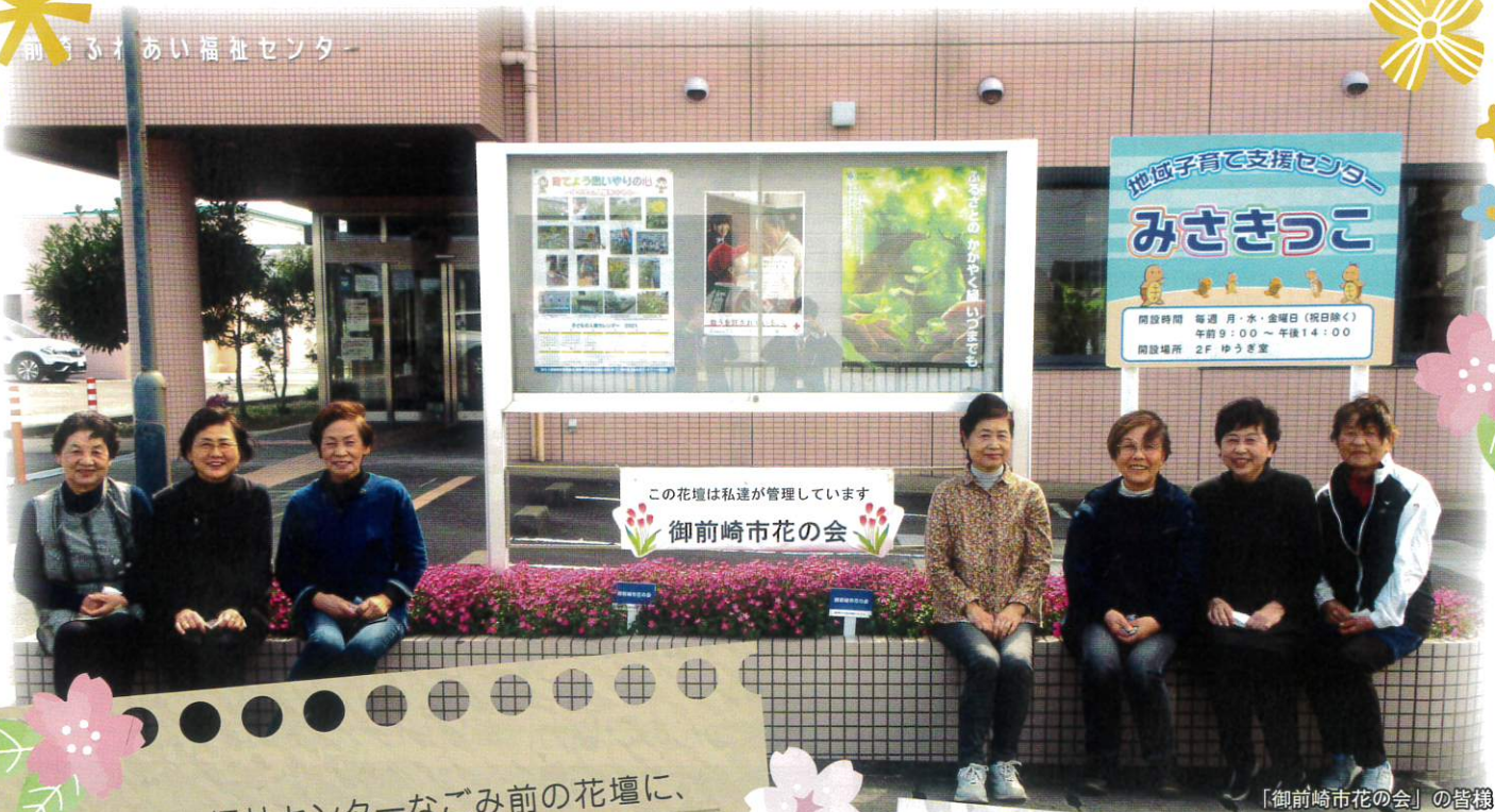
「御前崎市花の会」の皆様

ふれあい福祉センターなごみ前の花壇に、 「御前崎市花の会」の皆さんがツルコザクラを 植えてくださいました。