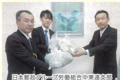
日本郵政グループ労働組合中東遠支部