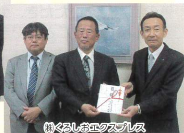
(株)くろしおエクスプレス