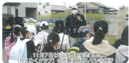
11月7日(土) 浜岡中央児童館「わくわくクラブ」の児童に説明している様子

案内人を務めるお2人ですが、他地域の人から初めて聞く御前崎のこともあるそうです。知らないことで大切なものを失ってしまわないように、という思いも込めて、歴史を伝える活動をされていました。