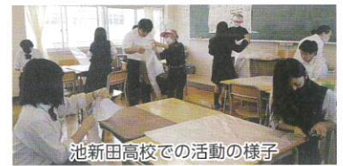
池新田高校での活動の様子

御前崎市ボランティア連絡会(以下ボラ連)は、静岡県ボランティア協会(以下 県ボラ協)主催でビニールエプロンとガウンを手作りするプロジェクトに参加 しました。会員有志が集い20着作製し、その後、池新田高校と相良高 校のボランティア部からの要請を受けてボラ連役員が出向き、指導しながら合わせて30着作製しました。 完成品は県ボラ協を通して必要とする医療機関や施設へ配送されます。