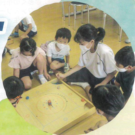
放課後児童クラブ/ 児童館での活動