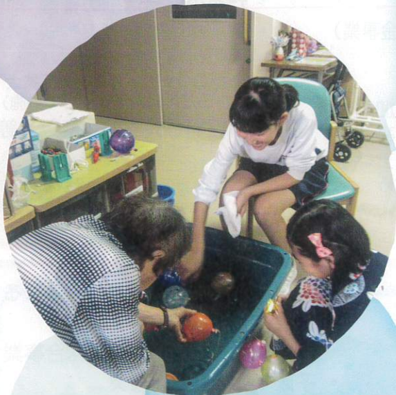
高齢者 デイサービスでの活動