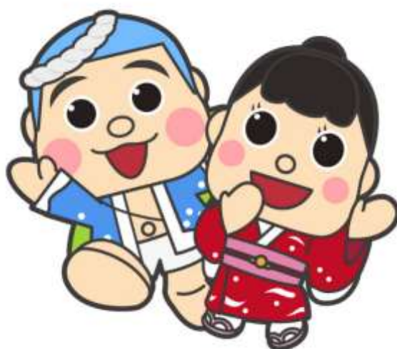
御前崎市マスコットキャラクター なみまる ふうちゃん