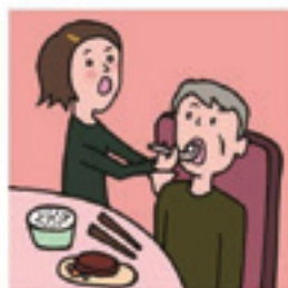
障がいや病気のある家族の身の回りの世話をしている