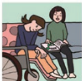
障がいや病気のあるきょうだいの世話や見守りをしている