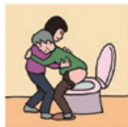
障がいや病気のある家族の入浴やトイレの介助をしている

©一般社団法人日本ケアラー連盟 / Illustration: Izumi Shiga