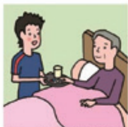
がん・難病・精神疾患など慢性的な病気の家族の看病をしている