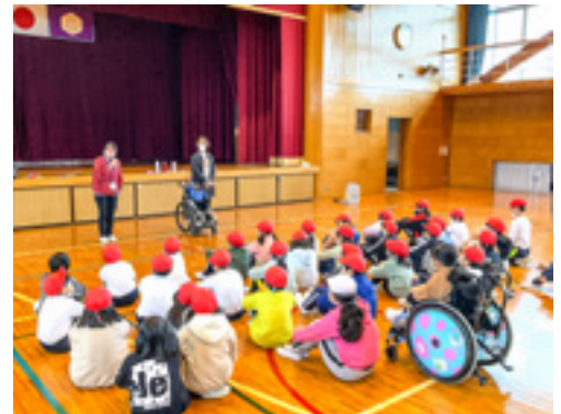
車いす体験の説明をする様子

「貴重な車いす体験をさせてくれて、車いすに乗っている人や押している人の気持ちがよくわかりました」「車いすを押してあげる機会があったら、習った通りしゃべりながら押してあげたいです」