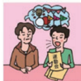
日本語が第一言語でない家族や障がいのある家族のために通訳をしている