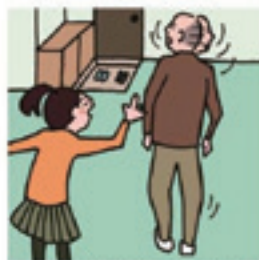
目を離せない家族の見守りや声かけなどの気づかいはしている