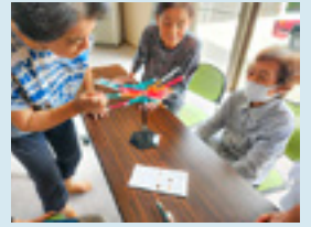
地域の仲間づくりである サロン活動に助成