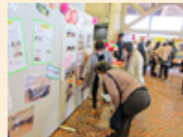
地域の福祉活動を紹介 (社会福祉大会)