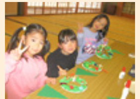
児童館では季節のイベントを 実施しています