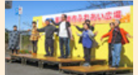
福祉団体の発表 (ふれあい広場)