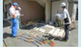
災害に備え、倉庫を点検