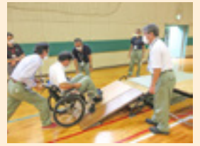
中部電力(株)職員様に車いす 等の使い方講座を実施