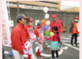
赤い羽根共同募金の 街頭募金活動

※令和3年度から開始した御前崎市第4次地域福祉計画・第4次地域福祉活動計画に基づき事業計画を策定しています。