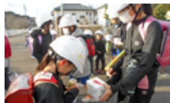
御前崎市立第一小学校の募金活動