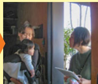
おかえりなさい！ おれこうだったよ。