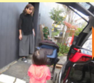
提供会員さんのお家に到着 荷物の確認などを行います