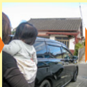
お母さん、お姉ちゃん いってらっしゃい