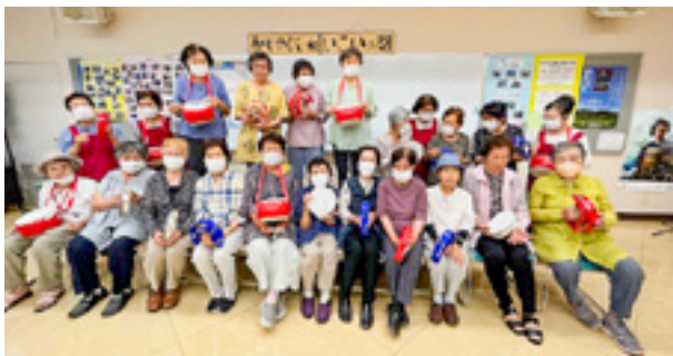
助成金で楽器を購入し高齢者サロンで活用

※地域福祉推進、参加者の健康増進のために事業を行う団体であること。自己研鑽・趣味の団体ではないこと。