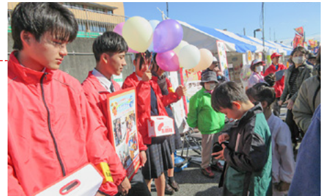
昨年の大産業まつりでの募金活動