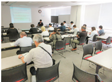
災害ボランティア コーディネーターの育成

運営は、災害ボランティアコーディネーターや団体など、地域の皆様に協力をいただきながら行います。ボランティア育成や訓練を実施し、いざという時に備えた体制作りを進めています。