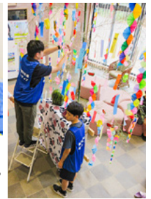
(左) こどもの居場所の様子 (中・右) 夏まつりではゲームや出店を楽しみました。 池新田高校ボランティア部も活躍