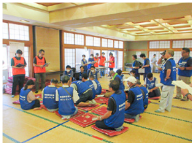
災害ボランティア 本部立ち上げ訓練